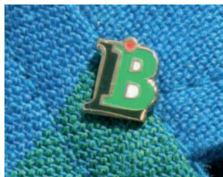
2010 – Erkennungszeichen LB

2011 1.360 Mitglieder. MV in BSS, 56 Teilnehmer/119 Stimmen. Der neue Anstecker LB wird vorgestellt. Pressekonferenz in Berlin. Brand-