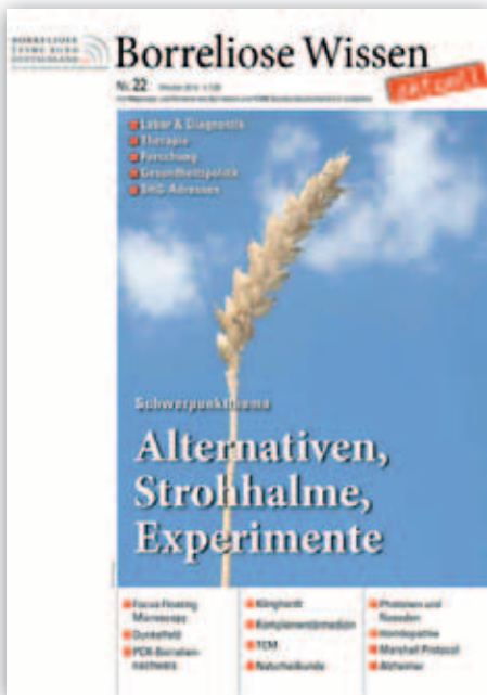
Borreliose Wissen Nr. 22/2010 „Alternativen“