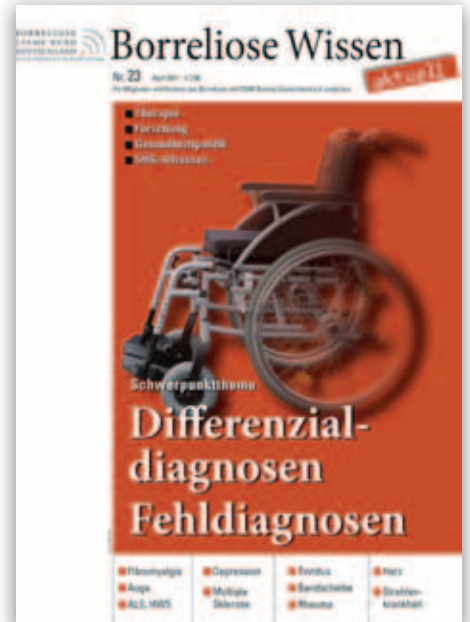
Borreliose Wissen Nr. 23/2011 „Fehldiagnosen“

briefe an Politiker aller Bundesländer. Vorstand reist ins Saarland und nach Rheinland-Pfalz und erreicht die Meldepflicht in beiden Bundesländern. Erneut 40.000 Kinderhefte verbreitet. Politische Reisen nach